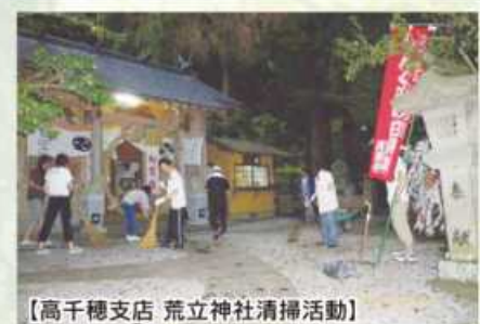
【高千穂支店 荒立神社清掃活動】

★熊本県信用組合協会主催のもと本店営業部にて「いきいき献血運動」を実施いたしました。 多くの皆さまにご協力いただきありがとうございます。 実施日：平成23年9月2日（金） 献血受付け者数71名 献血者数58名（400ml）