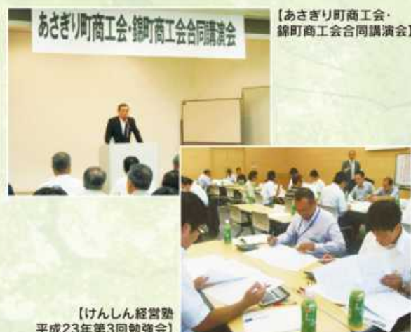
【あさぎり町商工会・錦町商工会合同講演会】

お客さまや地域の視点に立ち、真に地域に必要とされる協同組織金融機関を目指して、安心してご利用いただける一番身近な地域金融機関となれますよう、役員員一丸となって努力してまいります。