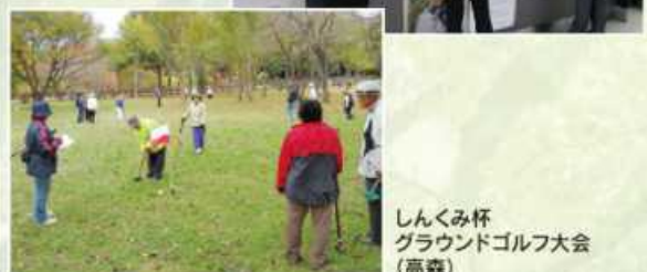
しんくみ杯グラウンドゴルフ大会（高森）

また、営業地域内にお住まいの個人の方には、住宅ローン「住まいるいちばんプラス」、当組合独自の住宅ローン「Sweet」、リフォームローン「匠の快築」をはじめ「奨学ローン」、カードローン「e-ライフ」、フリーローン「生活応援団」などお客さまのニーズに適した各種ローン商品の提供を行っています。