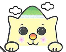
九州財務局 マスコットキャラクター 「にゃんぎゅう」

「自然災害による被災者の債務整理に関するガイドライン」により住宅ローンなどの免除・減額を申し出ることができます。